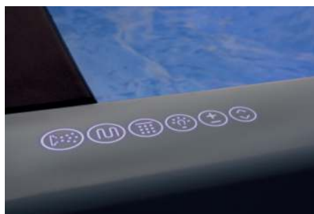
Pannello di controllo Touch retroilluminato Backlit touch control panel