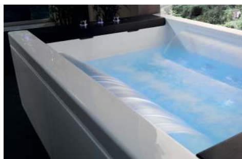
Idromassaggio con lama d'acqua Hydro-massage with waterfalls